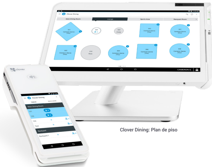
Clover Dining: Plan de piso

Características que necesitas. Actualizaciones que amarás. Domina la felicidad de tus clientes con Clover Dining.