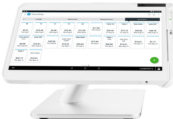
Clover Dining: Órdenes

Más información poderosa con cada cliente